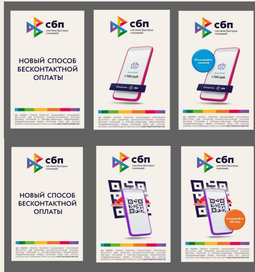
3. Ротация диджитал-баннеров с кнопкой и с QR-кодом

Анимуем луч, сканирующий QR-код и нажатие на кнопку